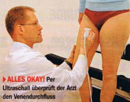
► ALLES OKAY! Per Ultraschall überprüft der Arzt den Venendurchfluss

neue sanfte Methode im Venenzentrum des St.-Maria-Hilf-Krankenhauses in Bochum nahe.